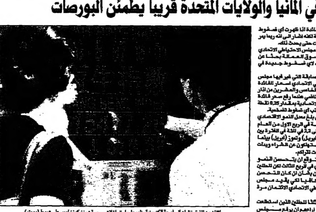
لجان من لارة بيطران في لجنة التفاوض بين العراق وفرنسا امس في بيروت

جنيف - رويترز - قال مجلس الطائرات الدولي امس الثلاثاء ان حركة الشحن الجوي العالمي ارتفعت بنسبة ستة في المئة في الربع الأول من هذا العام.